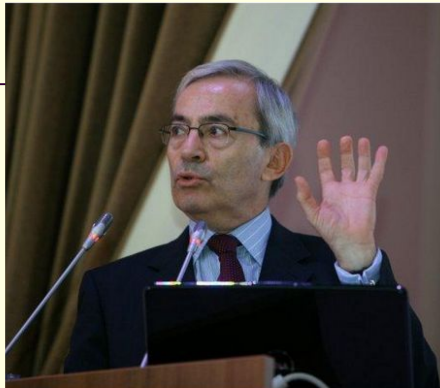
Лекция Кристофера Антониу Писсаридеса - лауреата Нобелевской премии в области экономики