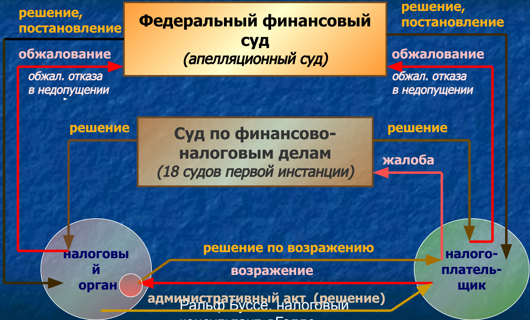
Схема юрисдикции в области налогового права в Германии (1)