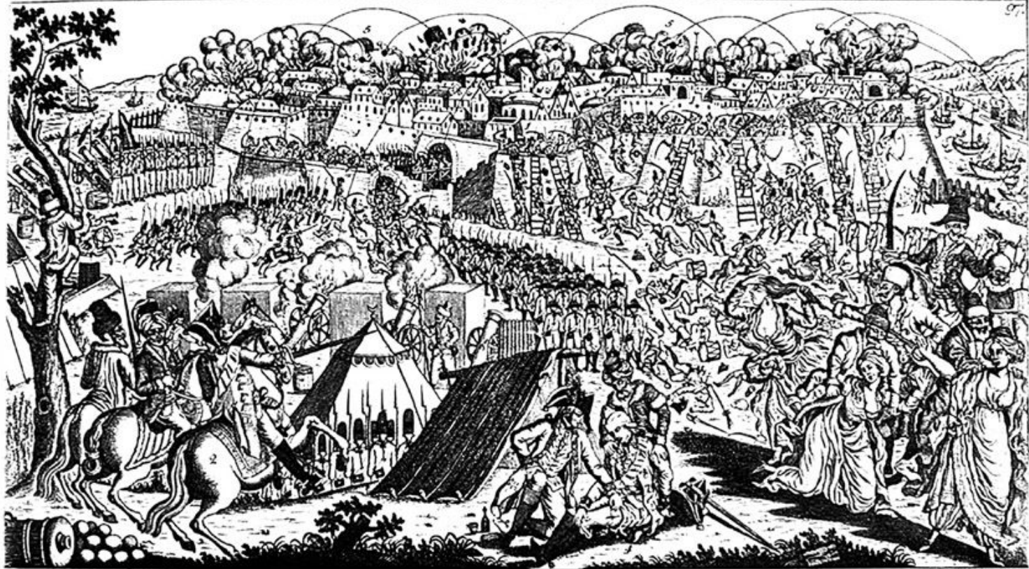
Взятие Измаила 22 декабря 1790 г. The Taking of Ismail by Suvorov