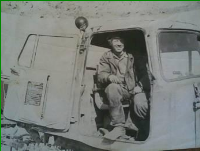
За штурвалом железного коня