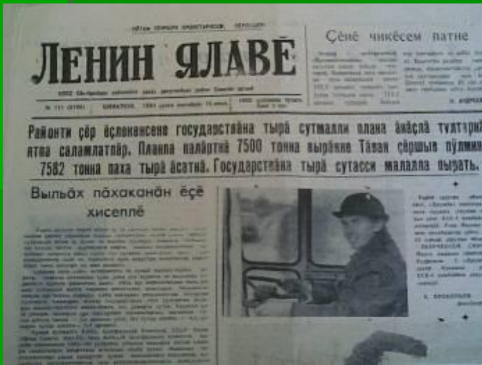
О нем писали в районной газете (1984)