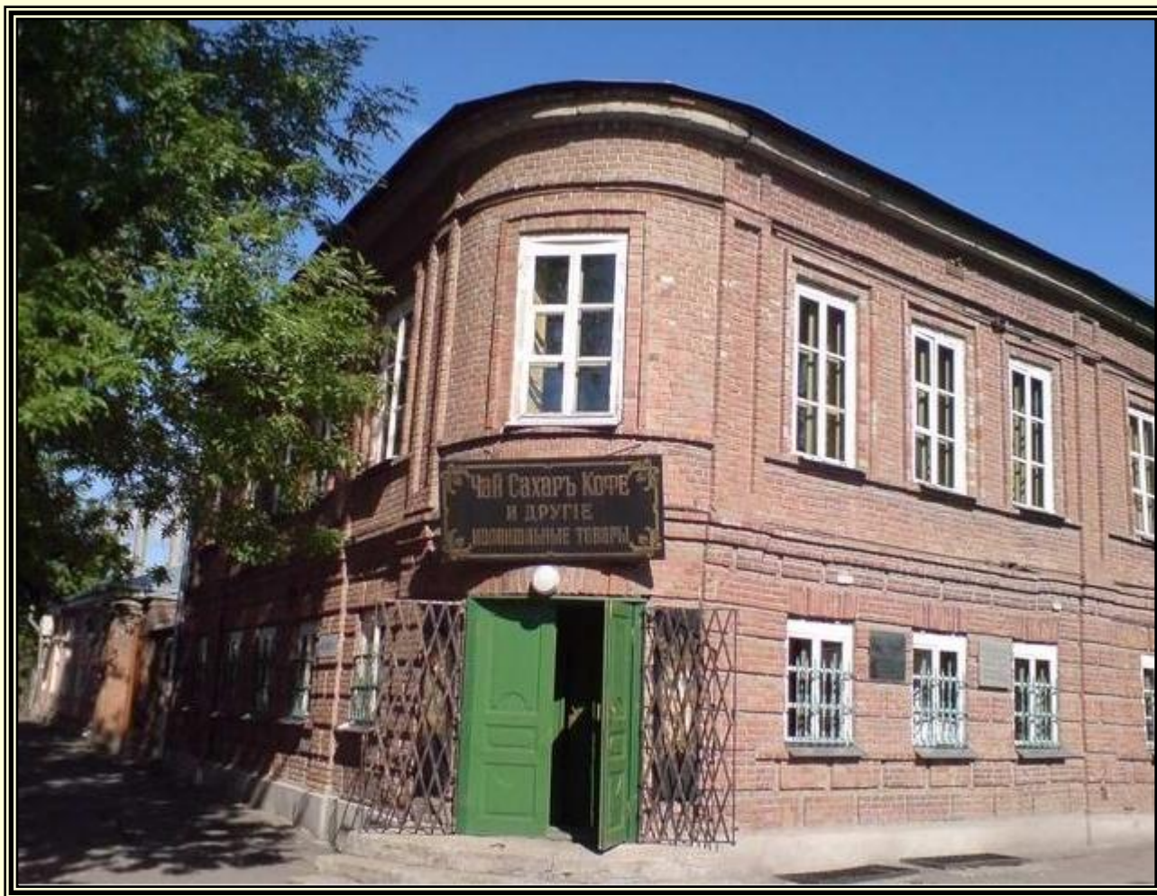
Лавка отца Чехова в Таганроге