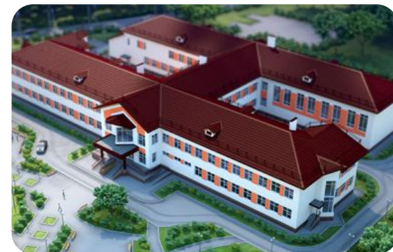
п. Кордово Курагинского р-на школа на 165 учащихся