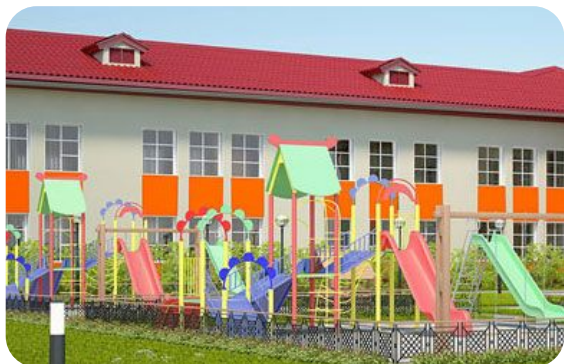
с. Ирша Рыбинского района школа на 50 учащихся с ДОУ на 30 мест