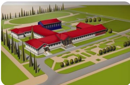
с. Покатеево Абанского р-на школа на 115 учащихся