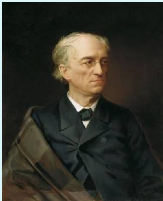
Федор Иванович Тютчев