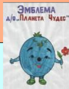
Объединение «Планета чудес»