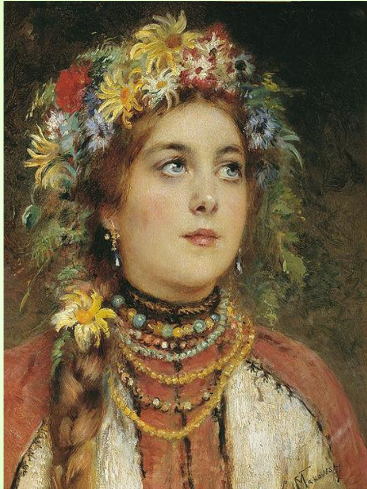
Картина «Русская красавица» К. Маковского