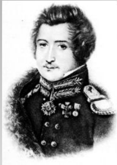
С. И. Муравьев- Апостол