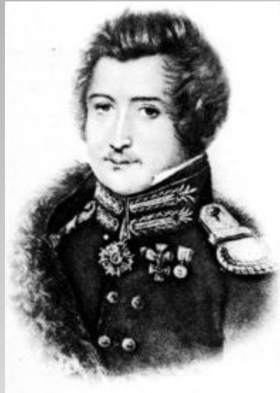
С. И. Муравьев- Апостол