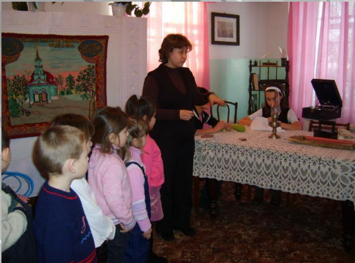
Наши дети в музее