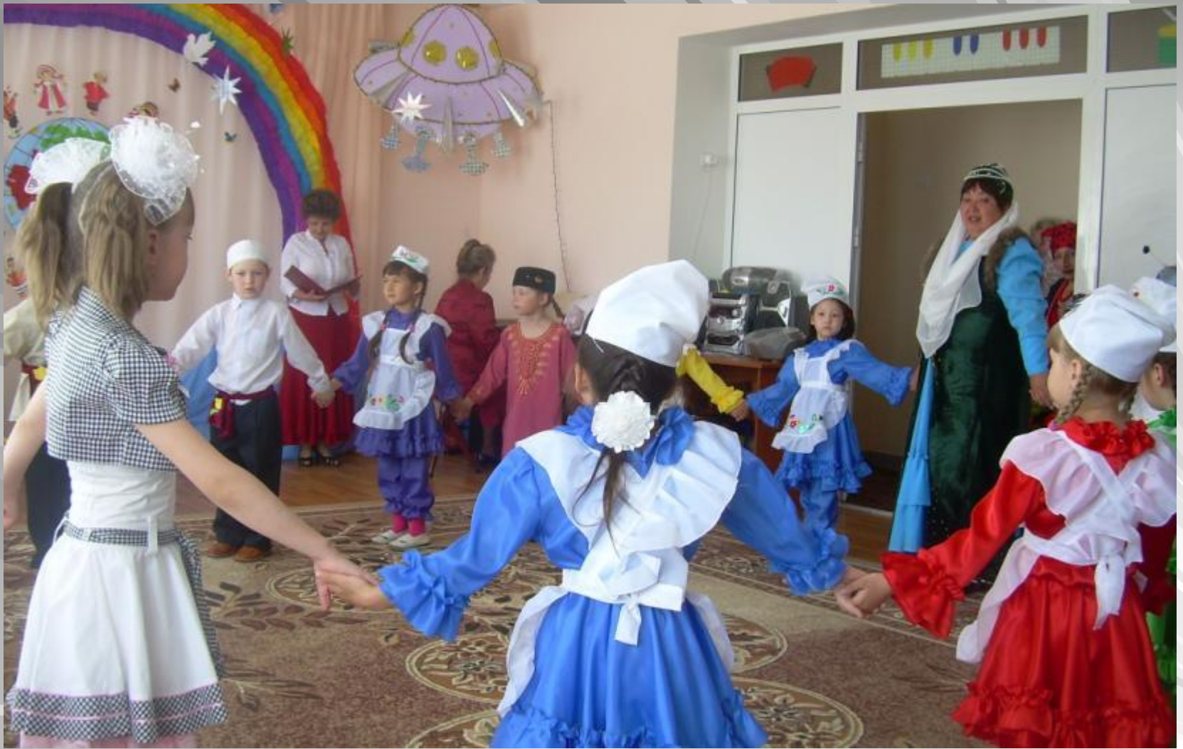
Звучит татарская национальная песня на празднике