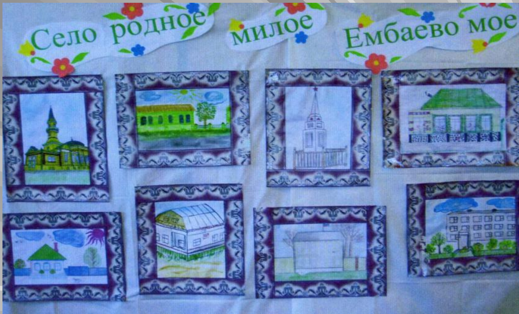
Совместные рисунки детей и родителей