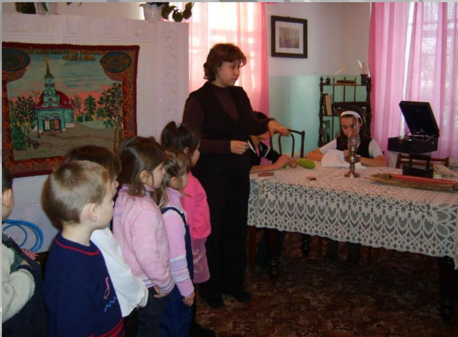
Наши дети в музее