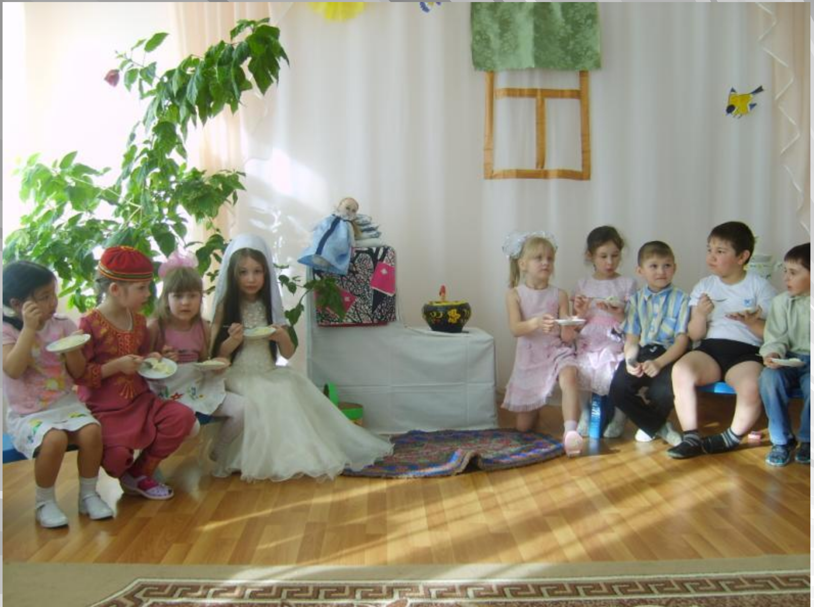
Очень вкусная каша