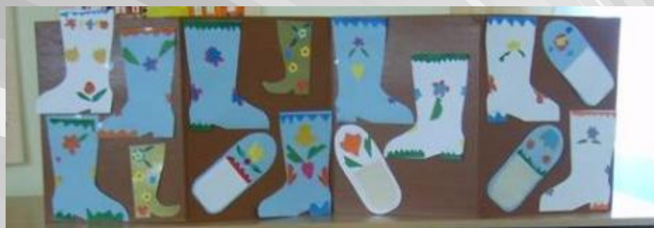
Работы наших детей