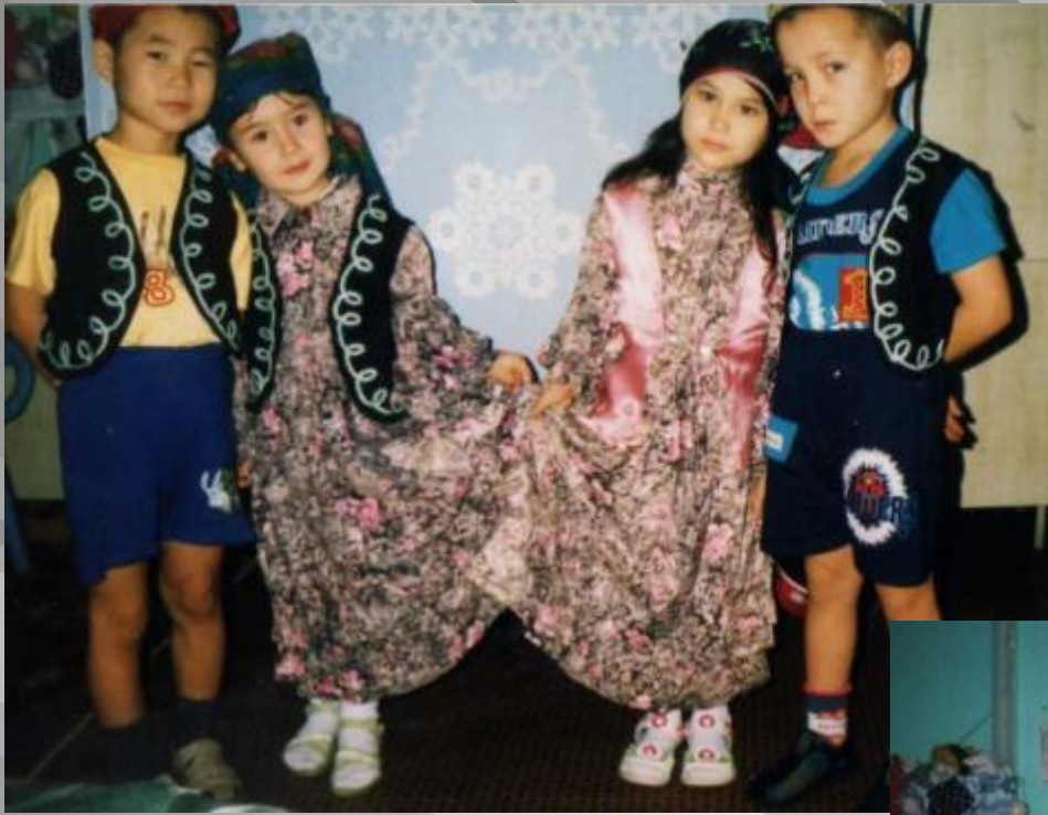
Татарский народный танец в исполнении детей старшей группы