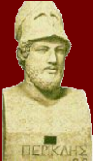
Перикла /490-429гг.до н.э./

■ В древней Греции появляются платные учителя - софисты (от греч. sophistes-искусник, мудрец), которые заложили основы риторики как науки об ораторском искусстве. В 5 в. до н.э. Коракс открыл в Сиракузах школу красноречия и написал первый (не дошедший до нас) учебник риторики. Античная эпоха дала миру великих ораторов: