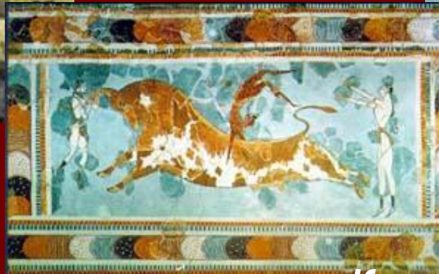
Дворцовые росписи на о. Крит