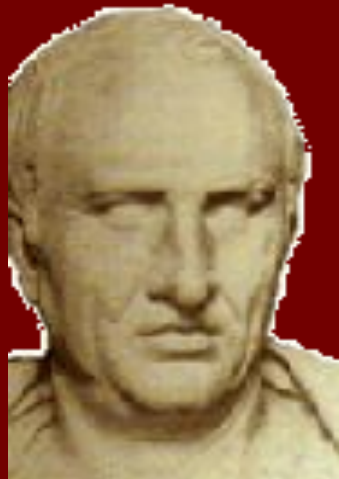
Демосфена /384-322гг.до н.э./