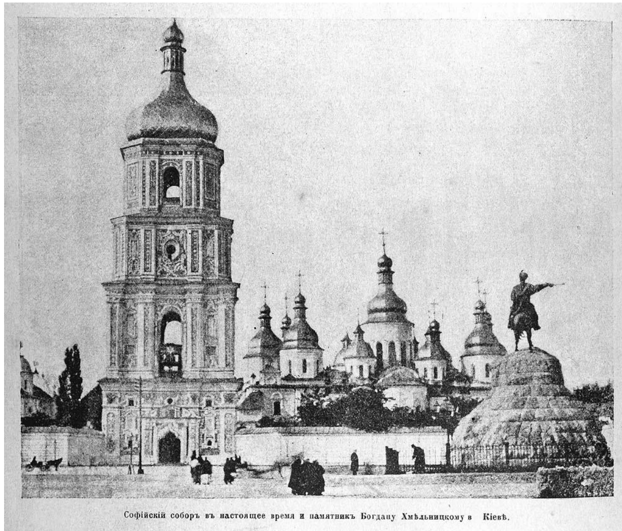
Софійскій соборъ въ настоящее время и памятникъ Богдану Хмельницкому в Кіевѣ.