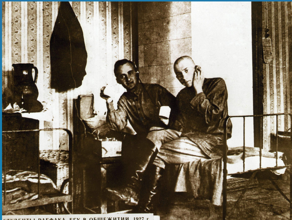
СТУДЕНТЫ РАБФАКА БГУ В ОБЩЕЖИТИИ. 1927 г.

4. Студенты Белорусского государственного университета остро нуждались в улучшении жилищных условий. И Правлению университета в условиях нехватки материальных средств, все же удалось отремонтировать студенческие общежития и постепенно закупать для них оборудование и инвентарь. Что касается пыли и грязи в общежитиях, то часто виной этому был низкий уровень бытовой культуры самих студентов.