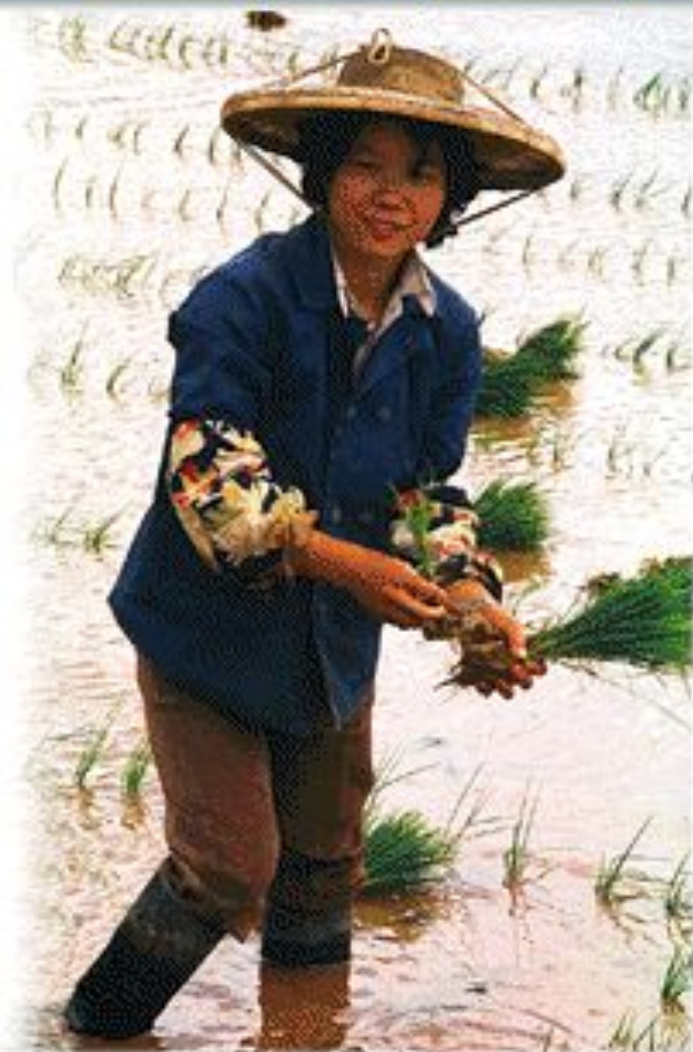
Рис растет на рисовых полях, залитых водой. Для более половины населения земного шара рис — основная пища.