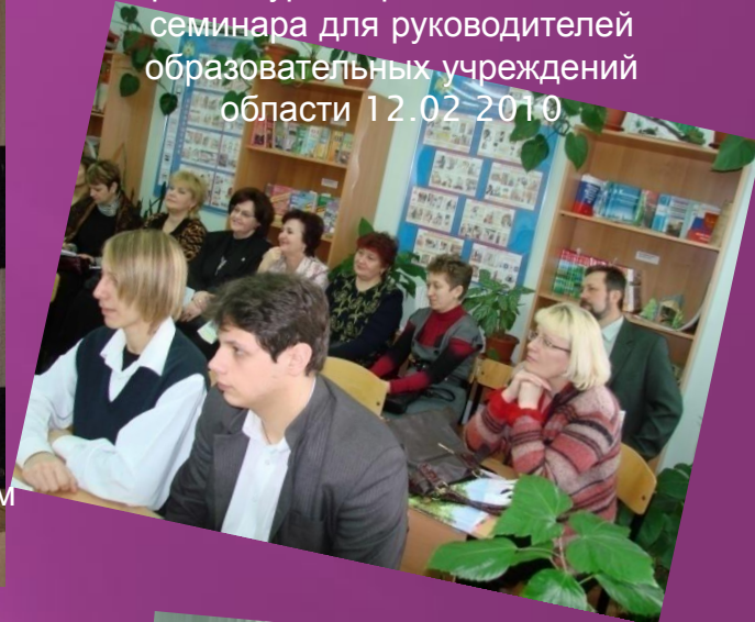
Открытый урок в рамках областного семинара для руководителей образовательных учреждений области 12.02.2010