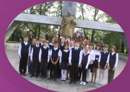
Урок - мужества