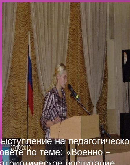
Выступление на педагогическом совете по теме: «Военно – патриотическое воспитание учащихся» 2010-2011 уч.год 27/10/2010