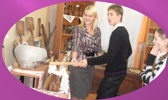
Организация работы школьного музея