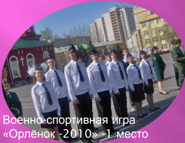
Военно-спортивная игра «Орлёнок -2010» -1 место