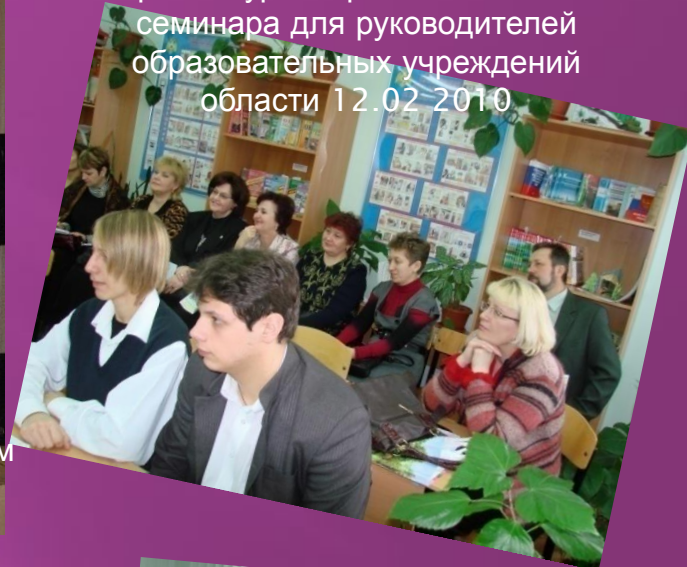
Открытый урок в рамках областного семинара для руководителей образовательных учреждений области 12.02.2010