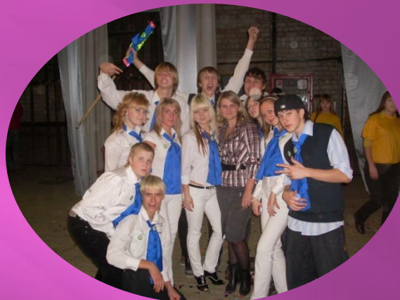
Команда КВН «Драйв»