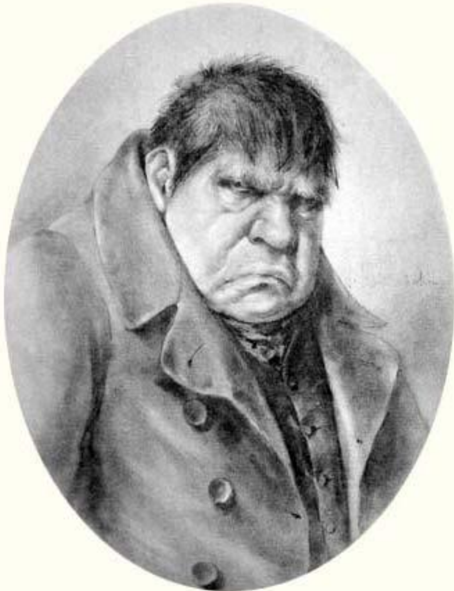
Михайло Семёнович Собакевич

В отличие от Ноздрева Собакевича нельзя причислить людям, витающим в облаках. Этот герой твёрдо стоит на земле, не тешит себя иллюзиями, трезво оценивает людей и жизнь, умеет действовать и добиваться того, чего хочет. Сам он отрицательно относится ко всему, что связано с культурой и просвещением: «Просвещение - вредная выдумка». Он хорошо понимает окружающую обстановку и понимает время, в которое он живёт, знает людей. В отличие от остальных помещиков он сразу понял сущность Чичикова. Собакевич - это хитрый пройдоха, наглый делец, которого трудно провести. Всё окружающее он оценивает лишь с точки зрения своей выгоды.