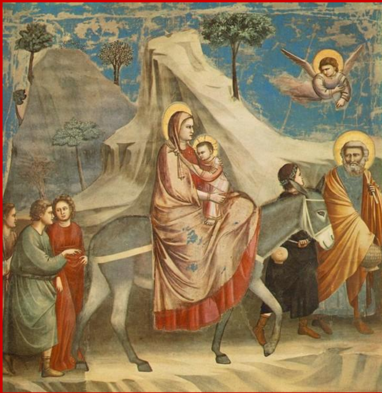
«Бегство в Египет»