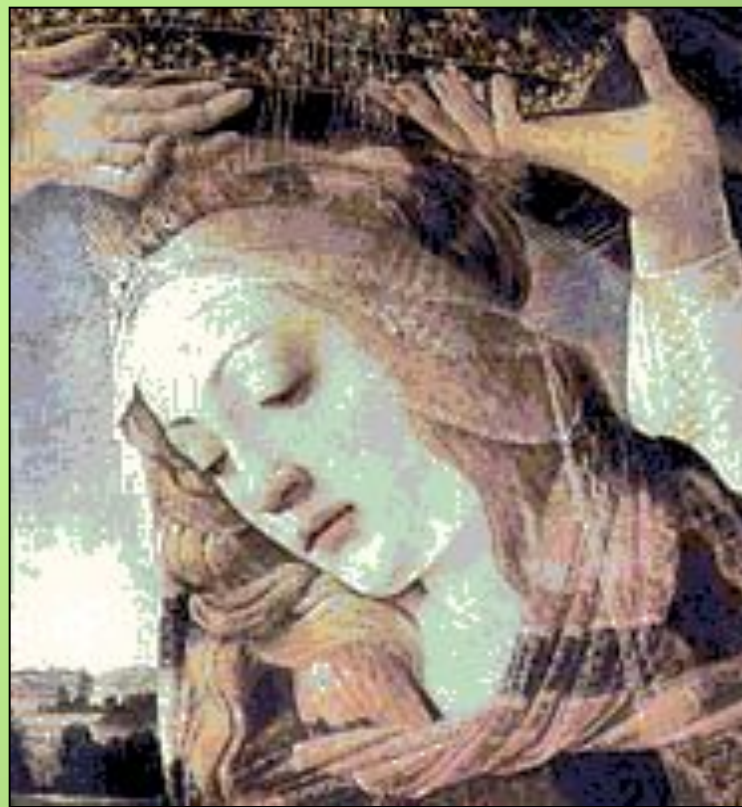
Фрагмент картины «Весна».