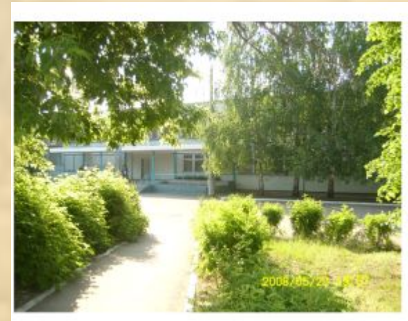
ОУ СОШ № 4