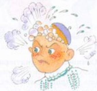
Кипит от негодования