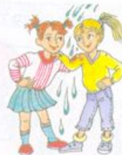
Водой не разольёшь