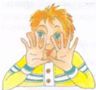
Смотреть сквозь пальцы

Объясните, правильно ли рисунки показывают значения фразеологизмов, в состав которых входят глаголы.