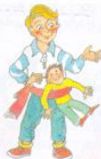
Заткнуть за пояс