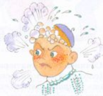
Кипит от негодования