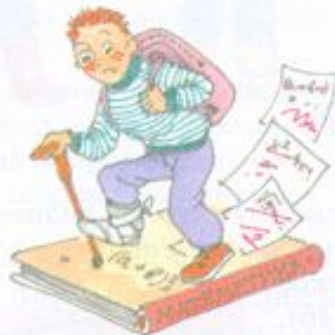
Хромает по математике