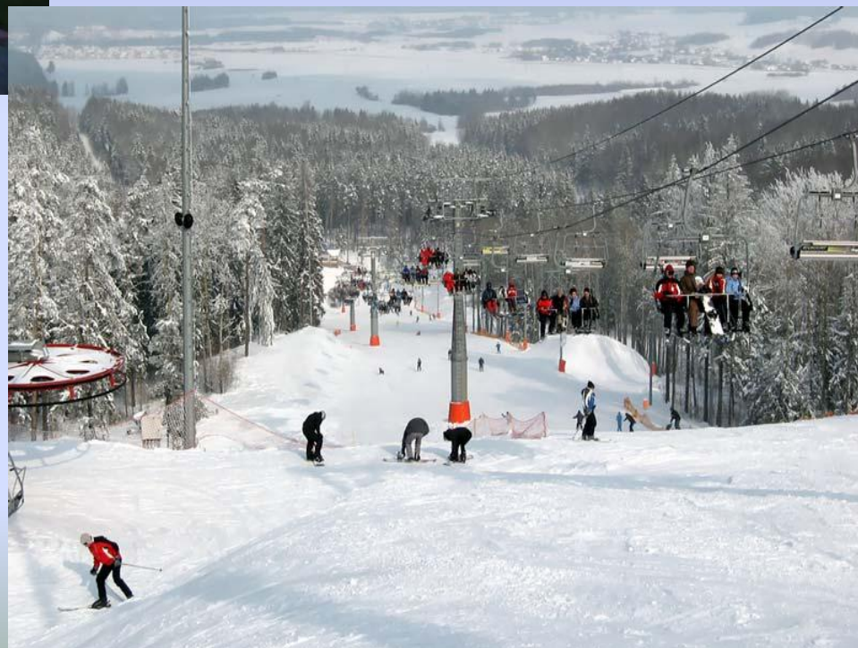
Горнолыжные курорт - Силичи!