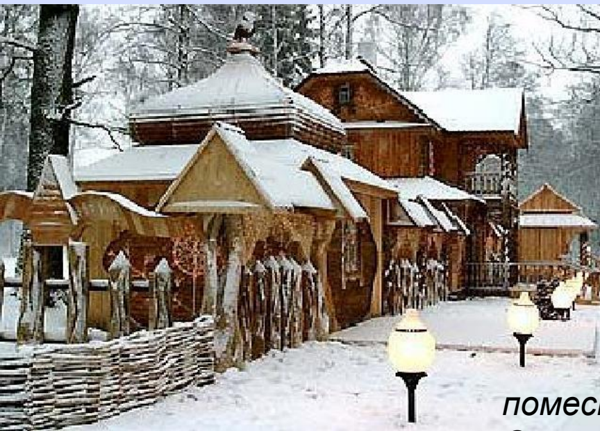
поместье Деда Мороза на Поляне