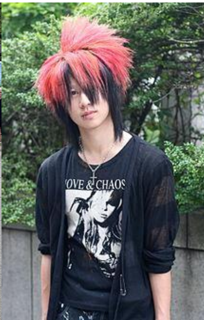
Поклонник visual kei