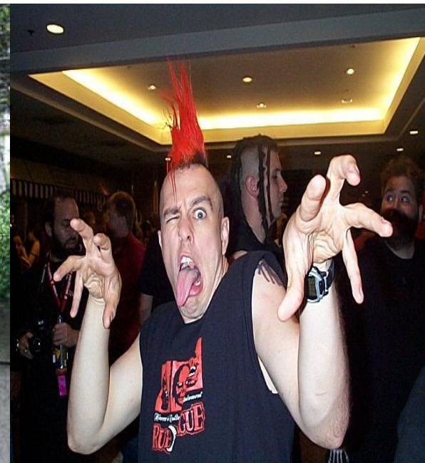
Панк с причёской «ирокез».