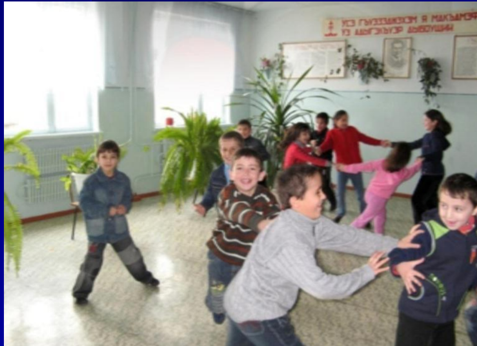
■ Детская рекреация У нас переменка