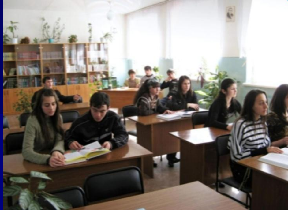
■ Читальный зал школы