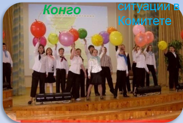
Награждены 6 сертификатами

В эти дни на русском, английском и французском языках в «Совете Безопасности» прошло обсуждение ситуации в Генеральной Ассамблеи» Комитете