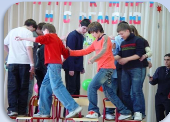
День толерантности в ГОУ ЦО №1468, интерактивная игра интерклубов г.