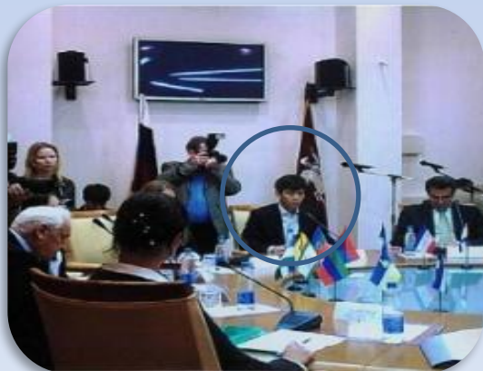
Президент интерклуба на международной