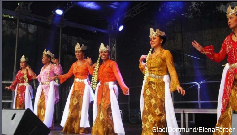
Stadt Dortmund/Elena Färber