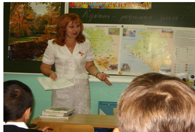
Рассказ, просмотр фильмов