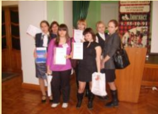
Победитель и лауреаты региональной конференции «Мир иностранных языков»