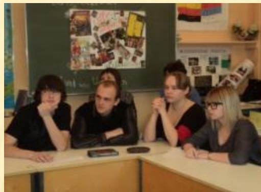
Мастер-класс по подготовке к ЕГЭ