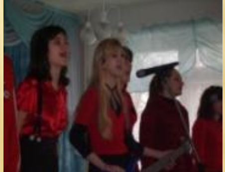
Проявление индивидуальности каждого в фестивале «Радуга»