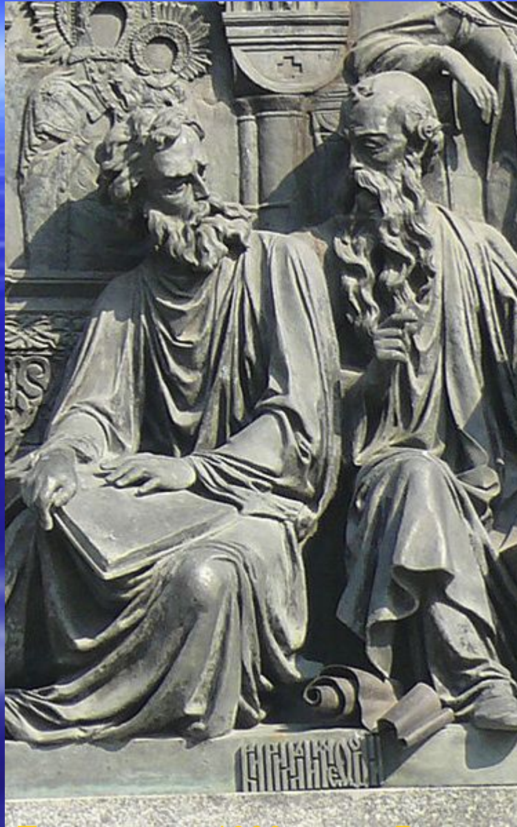
Кирилл и Мефодий на Памятнике «1000-летие России» Кирилл и Мефодий на Памятнике «1000-летие России» в Великом Новгороде