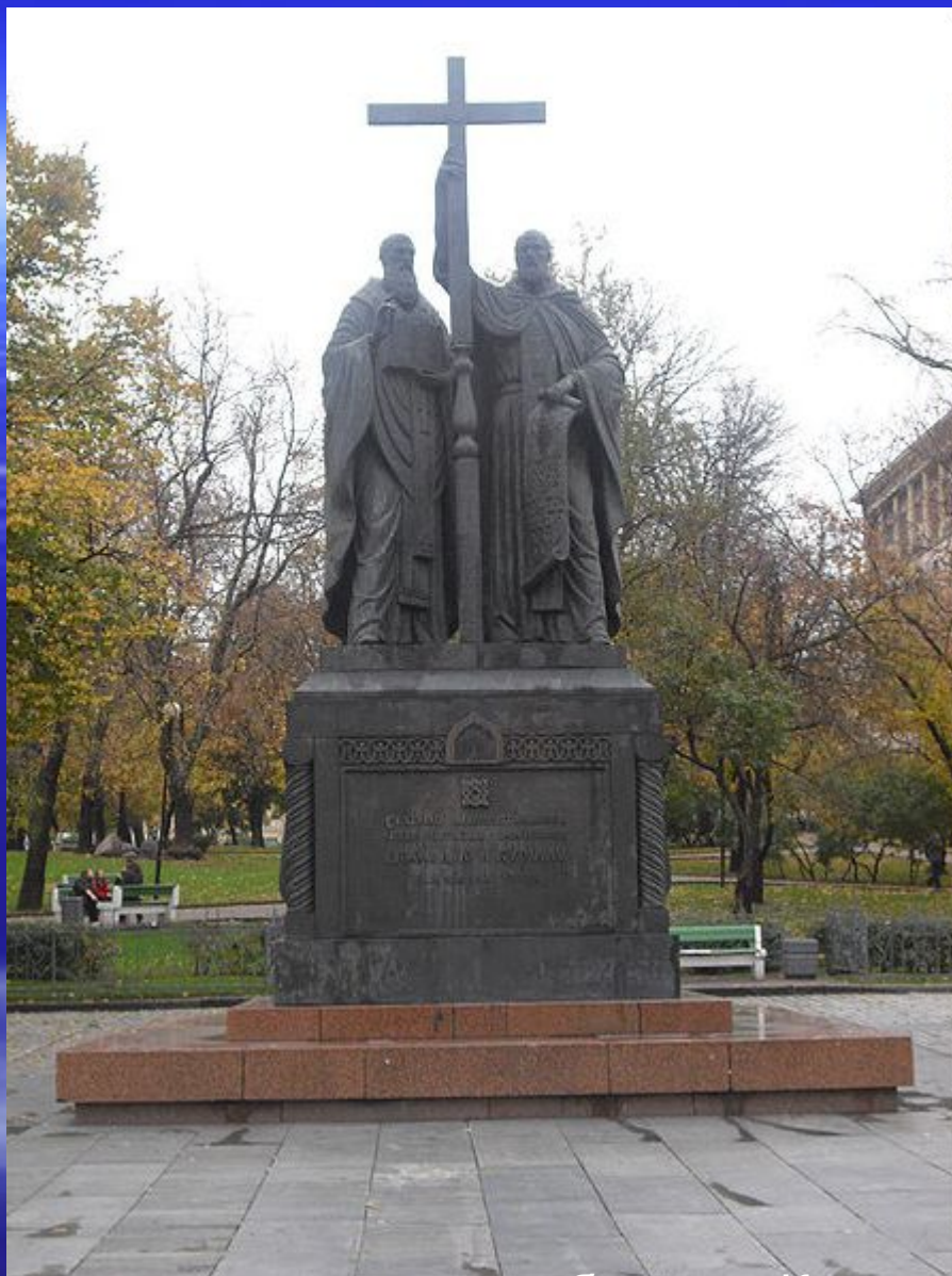
Памятник святым равноапостольным братьям Кириллу и Мефодию в Москве Памятник святым равноапостольным братьям Кириллу и Мефодию в Москве на Славянской площади