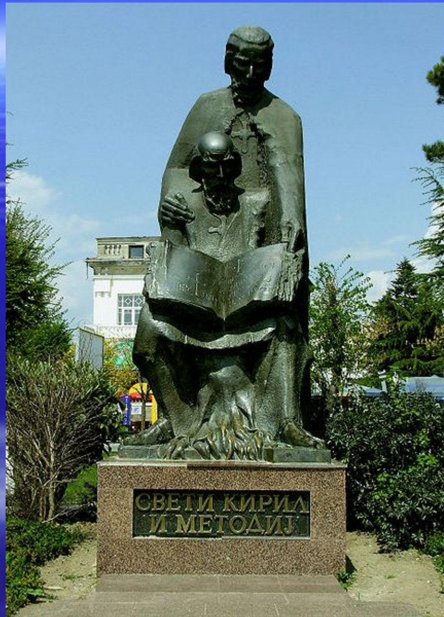
Памятник Кириллу и Мефодию в Охриде