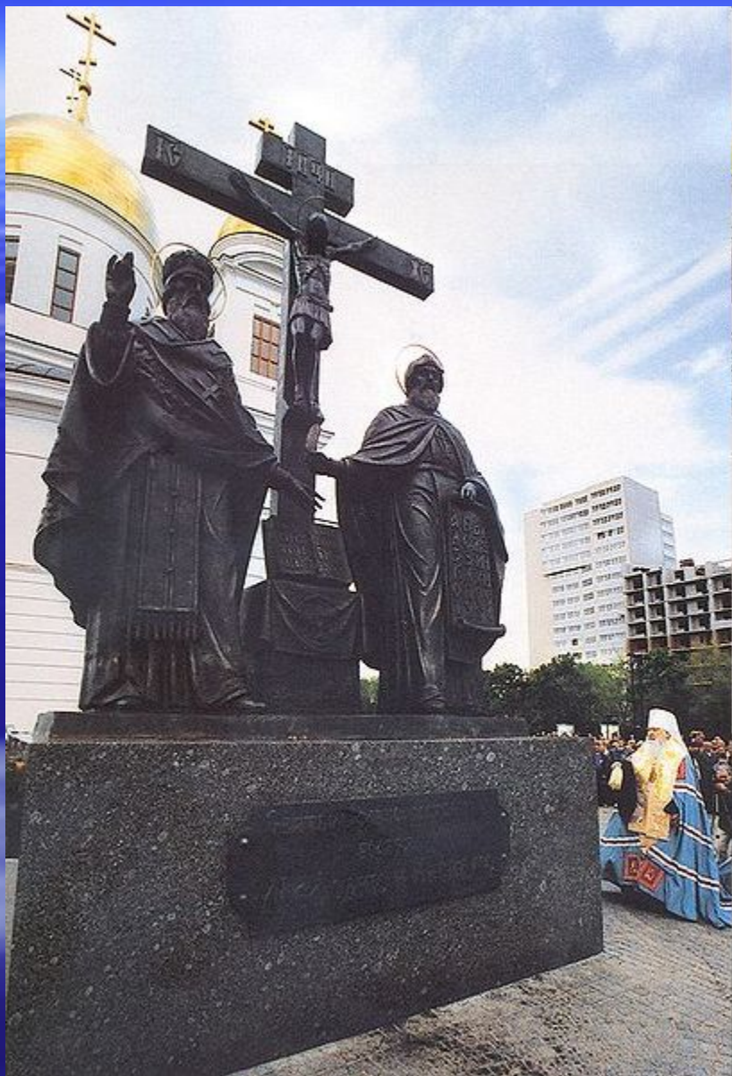
Памятник Кириллу и Мефодию в Самаре