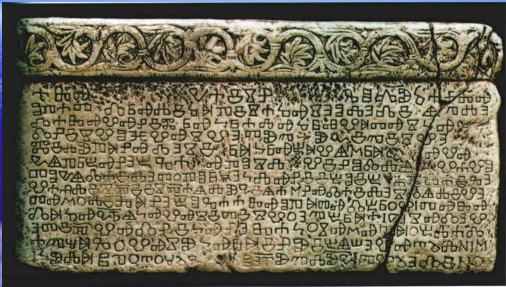
Башчанская (Бошканская) плита — один из древнейших известных памятников глаголицы, XI в.