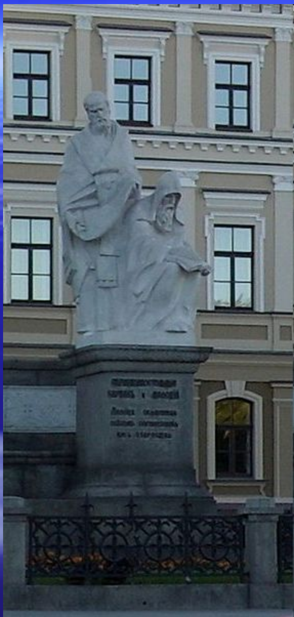
Памятник Кириллу и Мефодию в Киеве