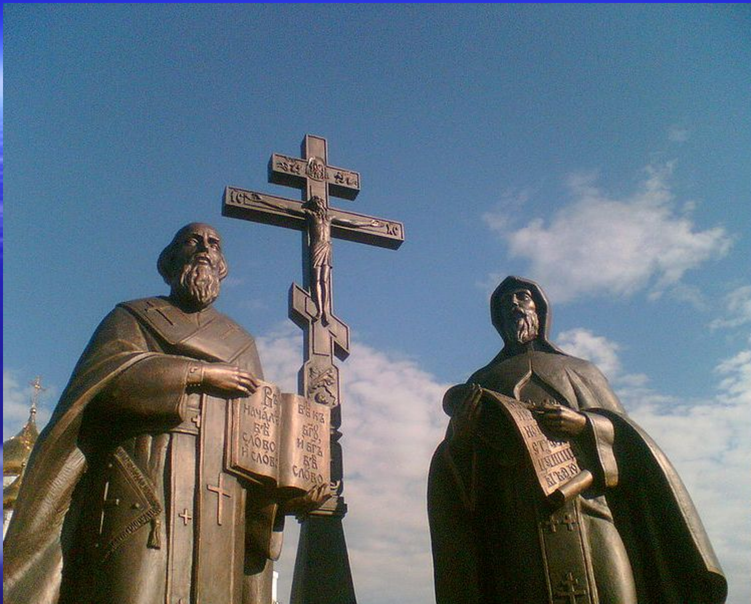
Памятник Кириллу и Мефодию в Ханты-Мансийске