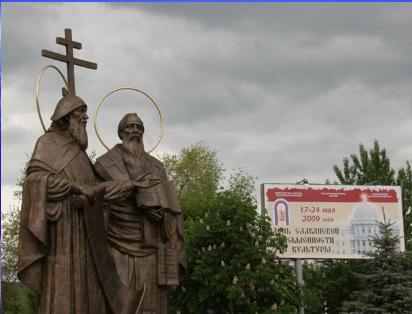
Памятник Кириллу и Мефодию в Саратове Памятник Кириллу и Мефодию в Саратове. Открыт 23 мая Памятник Кириллу и Мефодию в Саратове. Открыт 23 мая 2009 года