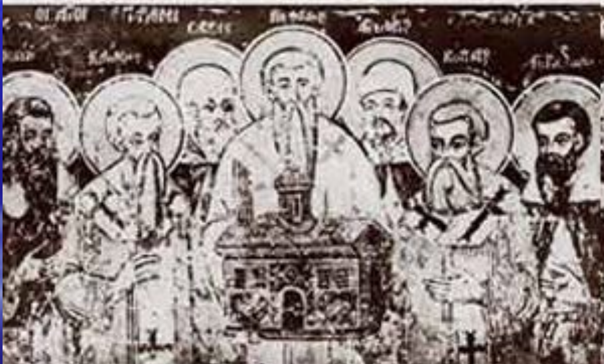
Кирилл и Мефодий с учениками. Фреска монастыря «Святой Наум», ныне в Республике Македонии.

философа . не ѿпримъ дръболии . чѣстнѣ и ши плаче всего зла тѣа и сѣбра . не ка менѣа драгаго . не бога тѣ . естѣла прѣходѣщаго . и поиди сѣни мѣ еспѣшно оутѣвѣрдни стѣ чь . не вѣсѣ мѣ сѣумѣ вѣнска стѣнѣга . не шѣвѣ