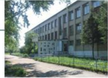
Муниципальное общеобразовательное учреждение «Средняя общеобразовательная школа №8» г. Сухой Лог с. Знаменское