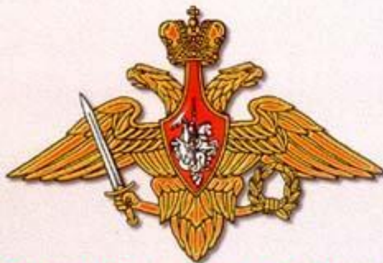
Эмблем Вооруженных Сил России