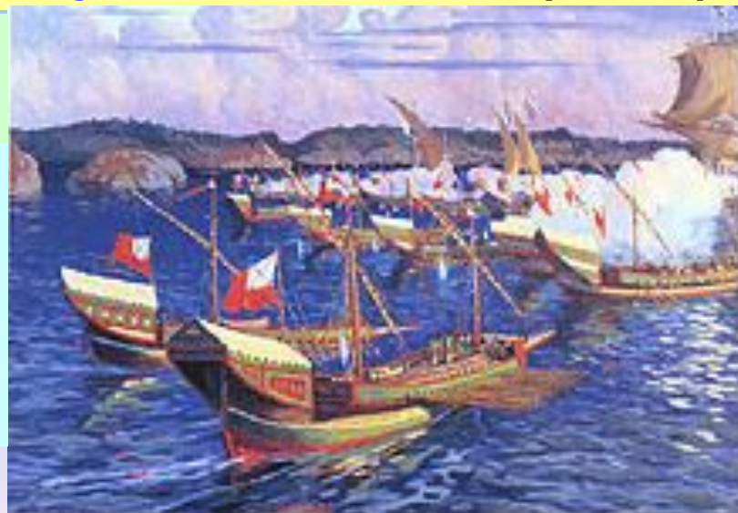
«Гангутское сражение. 1714 год».

Эта была первая морская победа над сильнейшим в то время шведским флотом, который до той поры не знал поражений