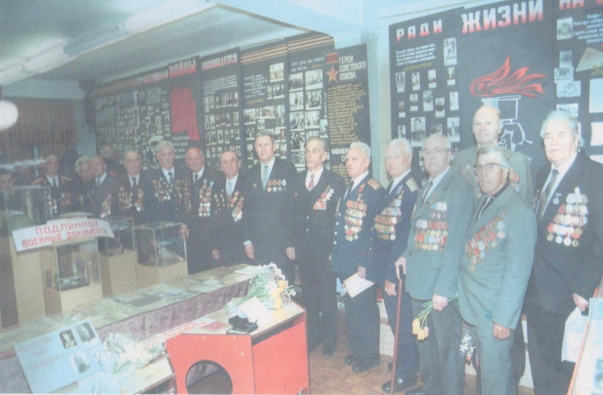
Ветераны ВОВ 27-й гвардейской стрелковой дивизии в зале школьного музея