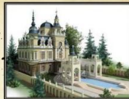
Неоготика Особенности стиля

«Теряя форму, гибнет красота, А форма четко требует закона» В. Солоухин, русский писатель