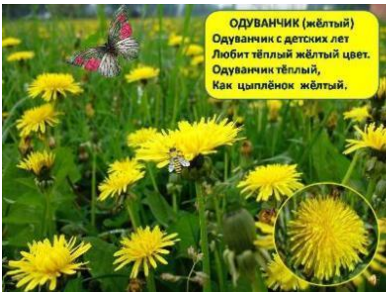
ОДУВАНЧИК (жёлтый) Одуванчик с детских лет Любит тёплый жёлтый цвет. Одуванчик тёплый, Как цыплёнок жёлтый.