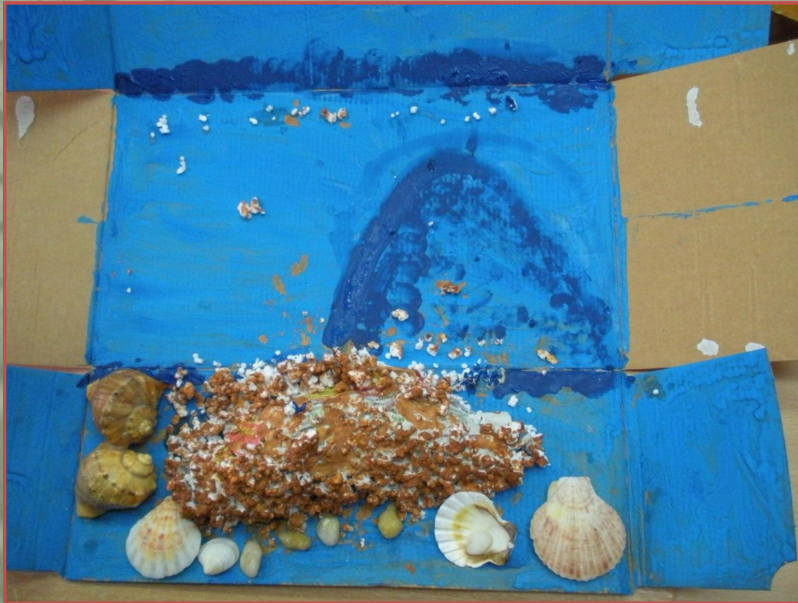
Картонная коробка в развороте