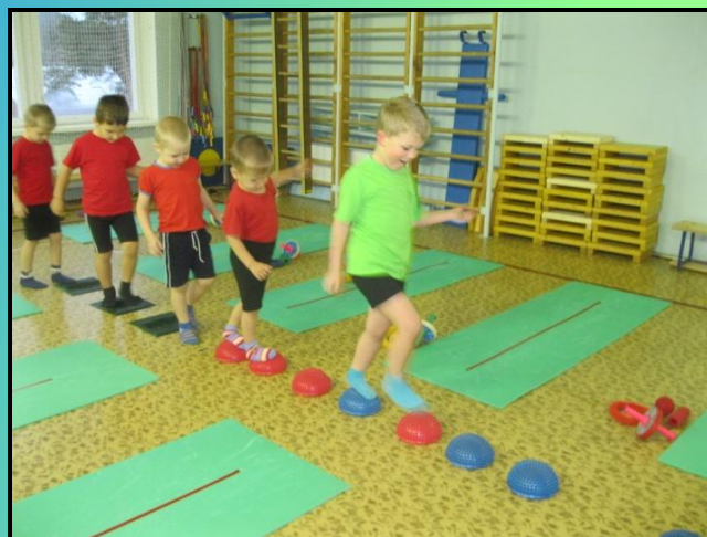
МАССАЖНАЯ БАЛАНСИРОВОЧНАЯ ПОЛУСФЕРА