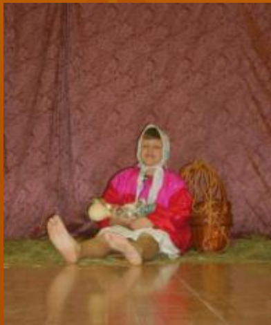
Показ «Варьяка» 5 «Б» классе