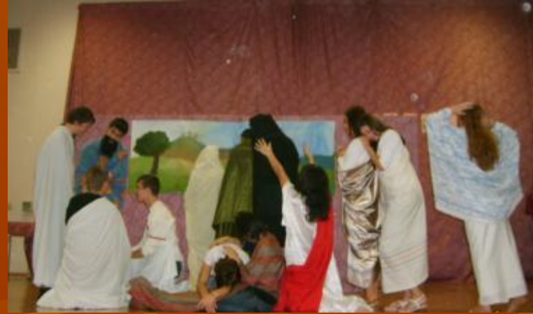
Показ репродукции 11 «А» класс «Жены, издали смотрящие на Голгофу»