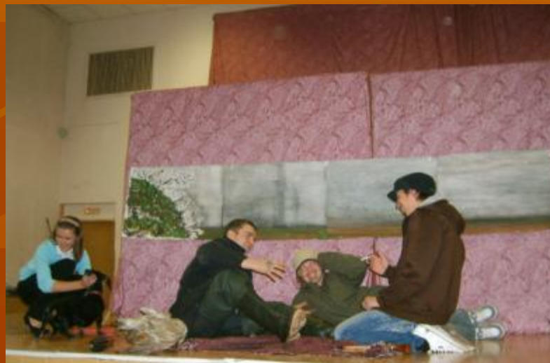
Показ репродукции 10 «А» класс «Охотники на привале»