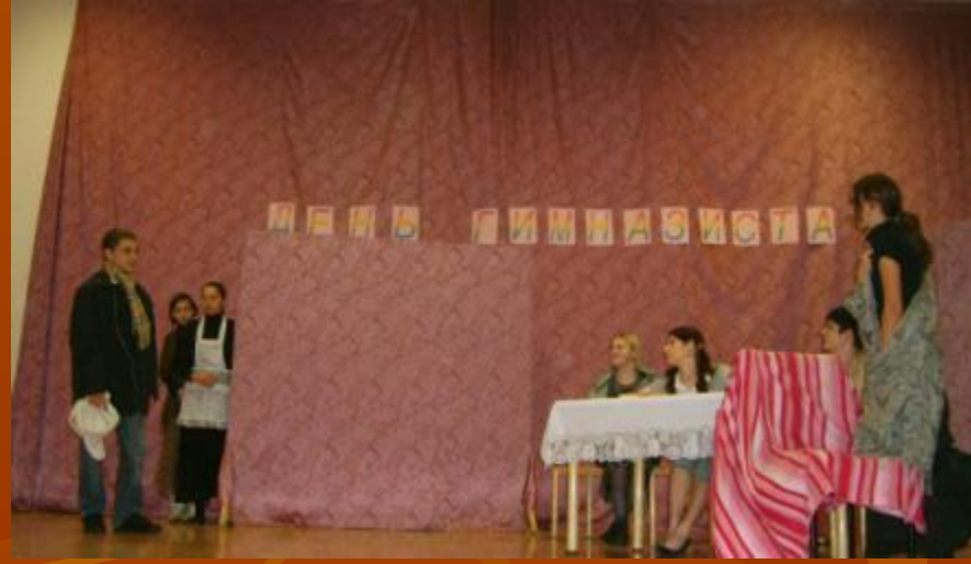
Показ репродукции 9 «А» класс «Не ждали»