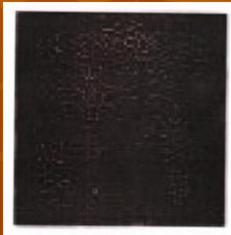
К. Малевич «Черный квадрат» Холст, масло