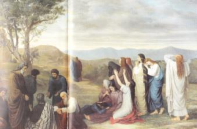
М. Боткин «Жены, издали смотрящие на Голгофу»