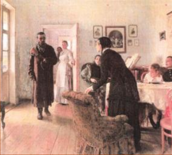
И. Репин «Не ждали»