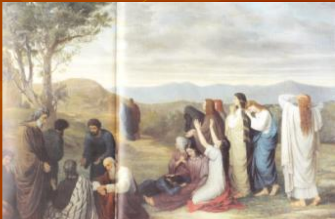
М. Боткин «Жены, издали смотрящие на Голгофу»