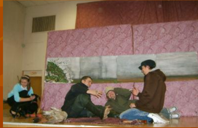
Показ репродукции 10 «А» класс «Охотники на привале»