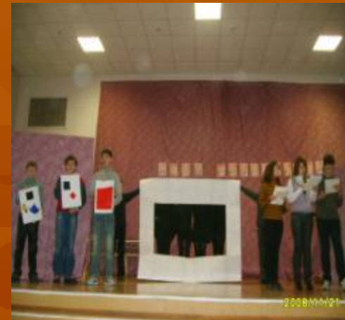
К. Малевич «Черный квадрат» Холст, масло