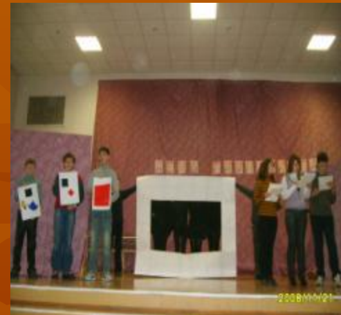
Показ репродукции «Черный квадрат» 7 «А» классе