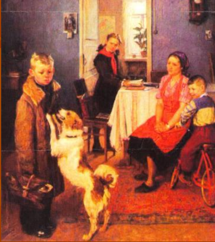
Ф. Решетников «Опять двойка»