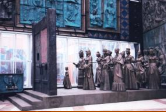
З. Церетели «Жёны декабристов»