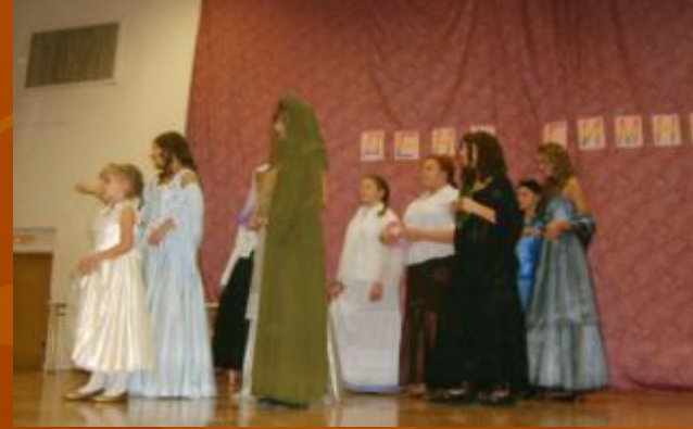
Показ репродукции 8 «А» класс «Жёны декабристов»