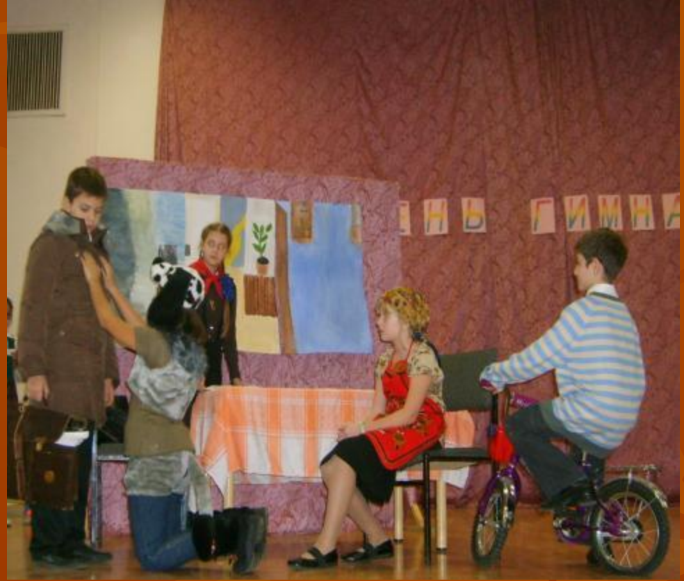
Показ репродукции 5 «А» класс «Опять двойка»