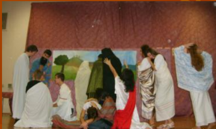
Показ репродукции 11 «А» класс «Жены, издали смотрящие на Голгофу»