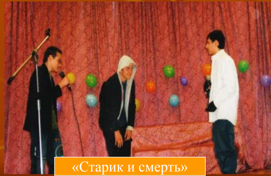
«Старик и смерть»