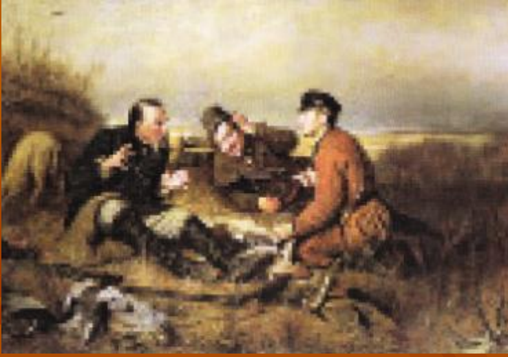
В. Перов «Охотники на привале»