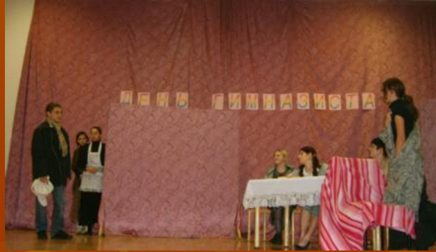
Показ репродукции 9 «А» класс «Не ждали»