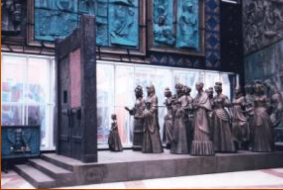
З. Церетели «Жёны декабристов»