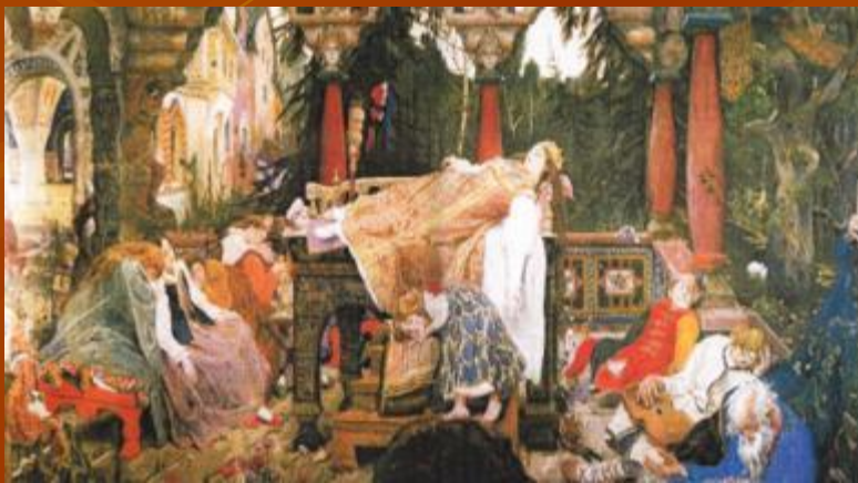
В. Васнецов «Спящая царевна» Холст, масло