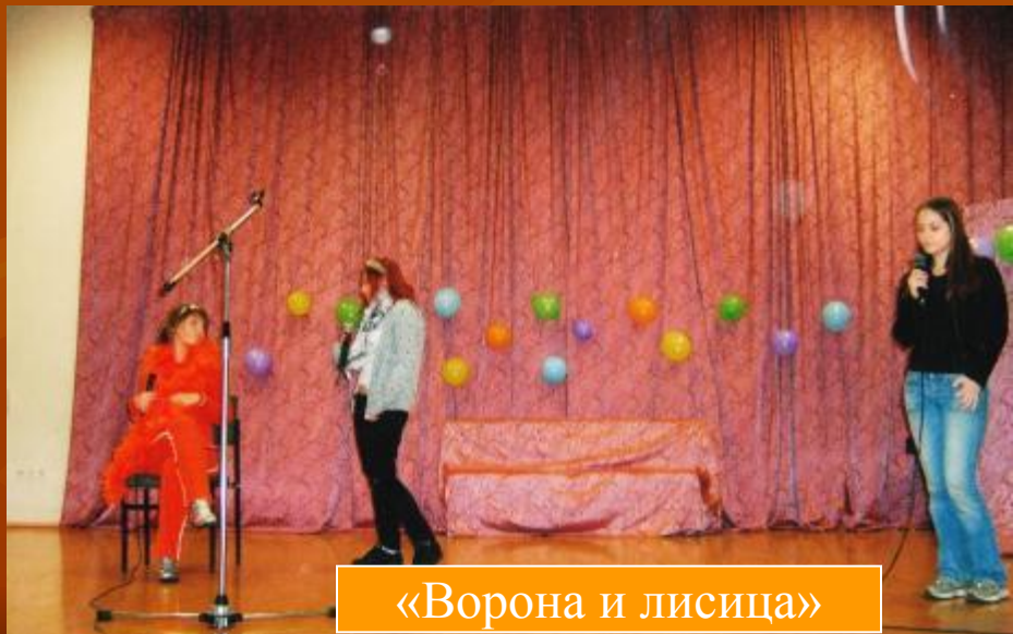
«Ворона и лисица»