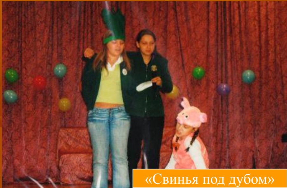
«Свинья под дубом»