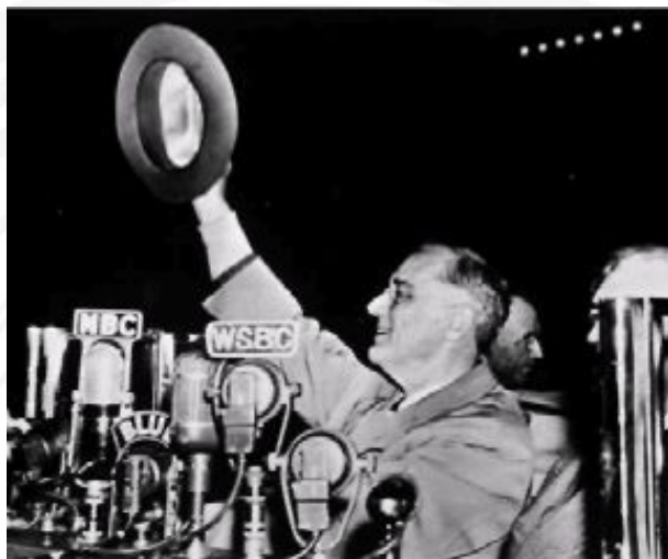
Франклин Д. Рузвельт, президент США во время Великого Кризиса (1882 - 1945)

"Лидер должен опережать свой народ на полшага (если на шаг, то он уже прожектёр)"