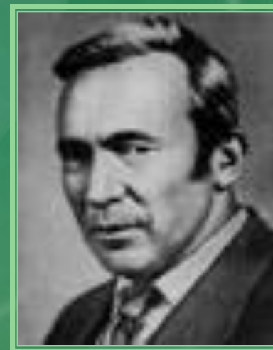
А. Н. Колмогоров