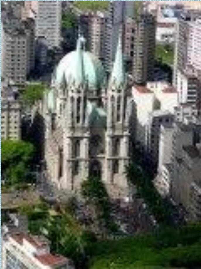
Сан - Паулу