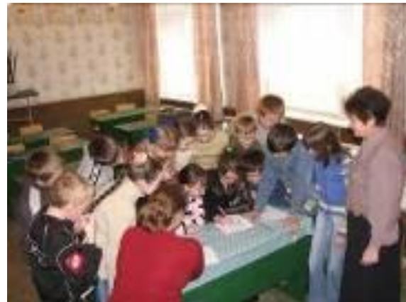
Дети-соавторы любого сценария