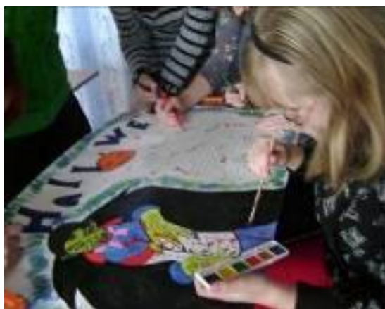
Конкурс тематических газет

Лингафонный кабинет – «ситуация успеха» для каждого ученика