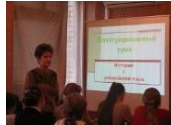
Интеграция знаний - основа обновления школьного образования