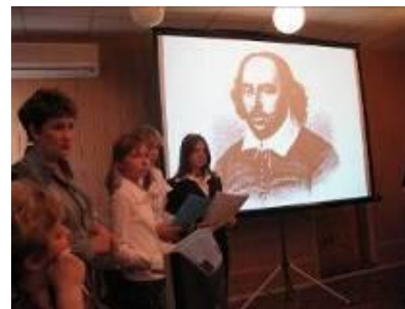
«В литературной гостиной»