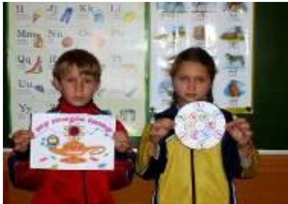
Мини-проект «Волшебная лампа»

Защита проектов - свободное раскрытие личностных возможностей учеников