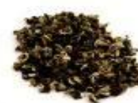
ROYAL GREEN SPIRAL