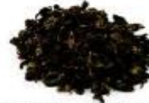
ROYAL BLACK DRAGON