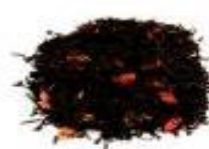
STRAWBERRY & MANGO