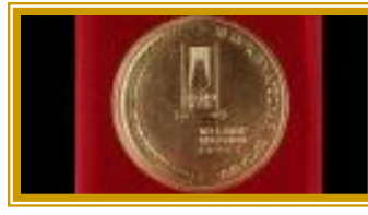
Золотые Медали World Food