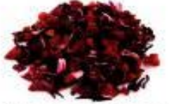
ROSEHIP & HIBISCUS