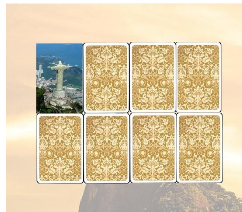
Первый уровень третьего тура , посвящённый статуе Христа-Искупителя