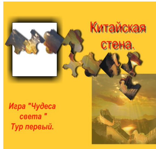
Первый уровень первого тура , посвящённый Китайской стене.