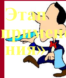
Этап «примене- ния»