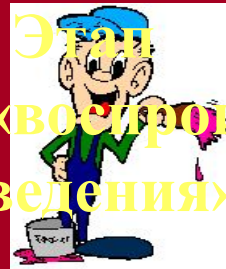
Этап «воспроиз- ведения»