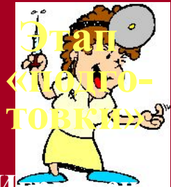
Этап «подгото- вки»