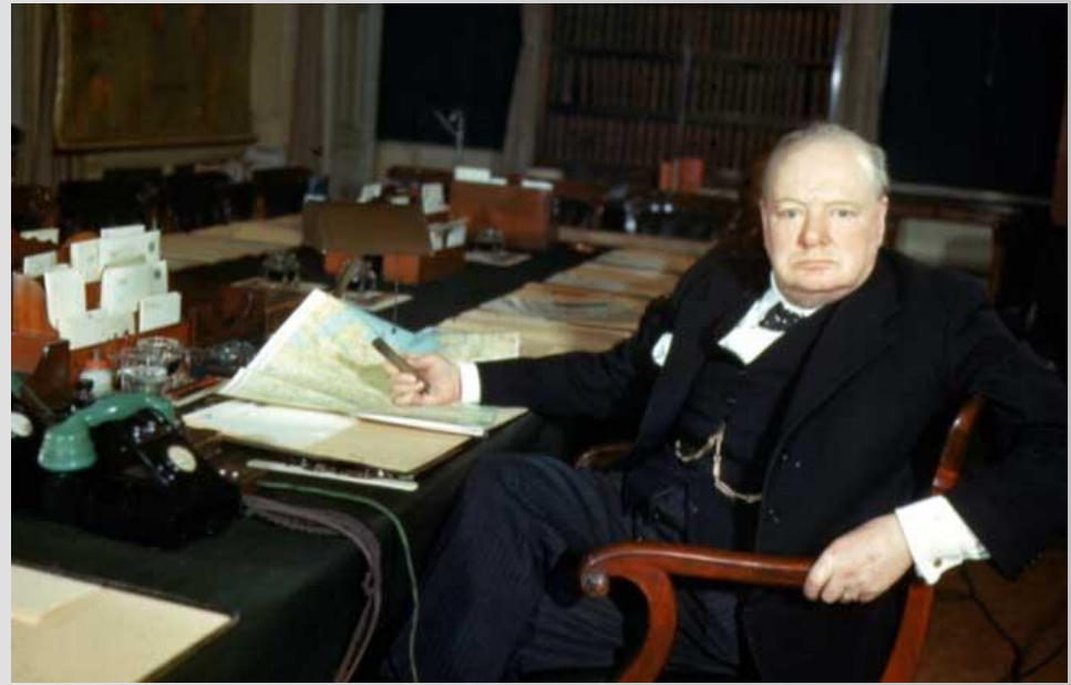
В своем кабинете

В 1946 г. в ходе поездки по США У.Черчилль выступил с речью в Фултоне (шт. Миссури), благодаря которой широкое хождение получил термин «железный занавес» (т.е. завеса секретности, окружавшая действия СССР). Фултонская речь считается сигналом для начала холодной войны.