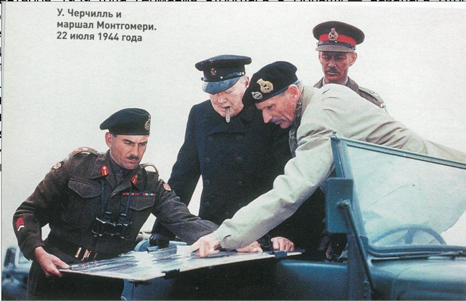
У. Черчилль и маршал Монтгомери. 22 июля 1944 года