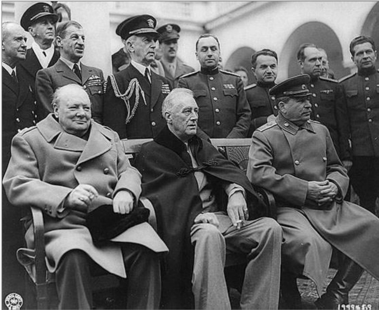
Черчилль, Рузвельт, Сталин на Ялтинской конференции. Февраль 1945