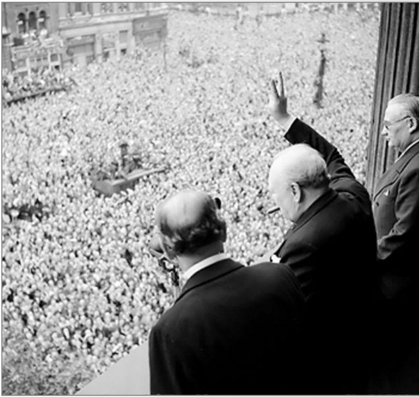
У.Черчилль перед народом 8 мая 1945 года