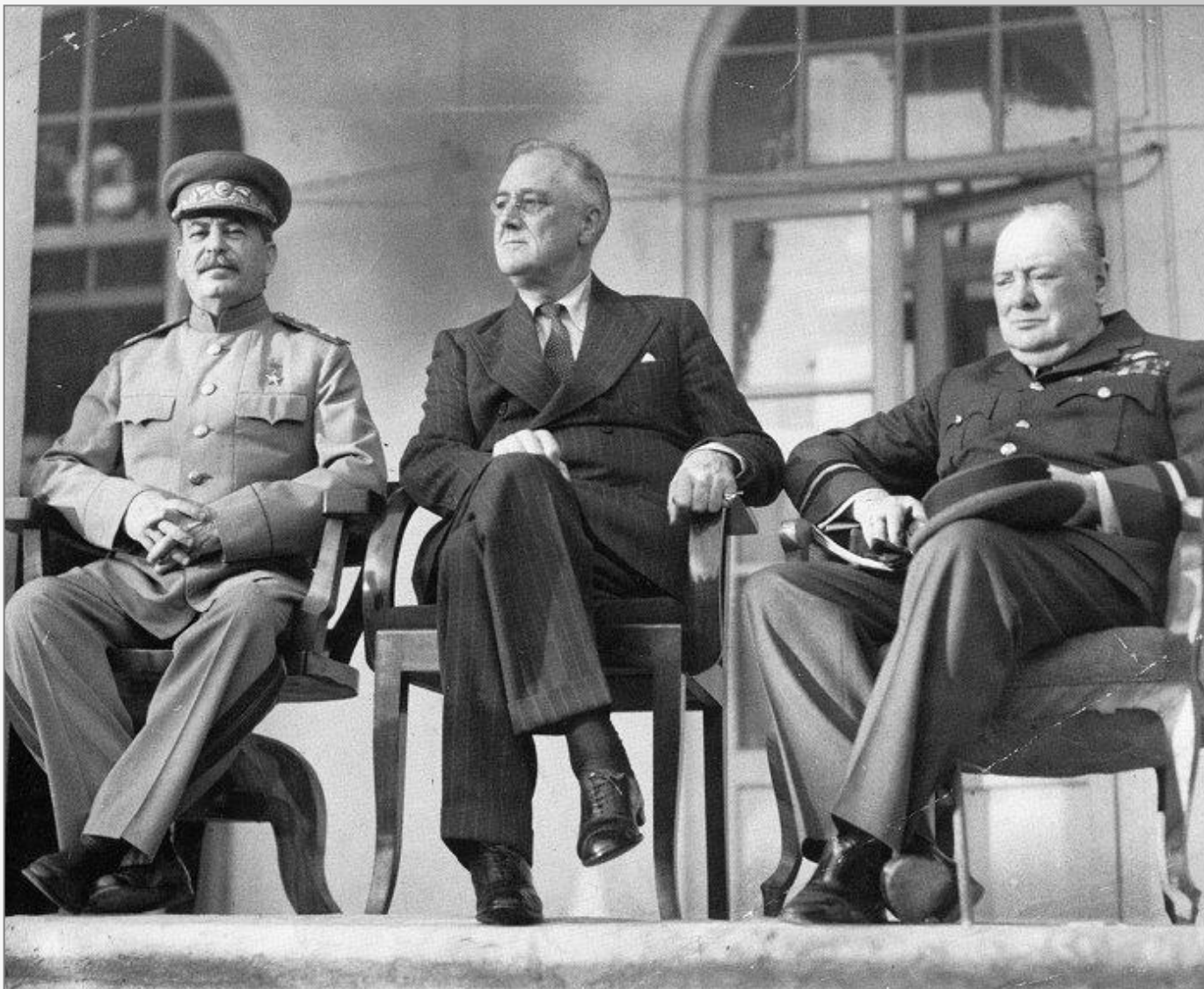
"Большая Тройка": Иосиф Сталин, Франклин Рузвельт и Уинстон Черчилль встречаются на Тегеранской Конференции, чтобы обсудить Театр военных действий в Европе в 1943 г.