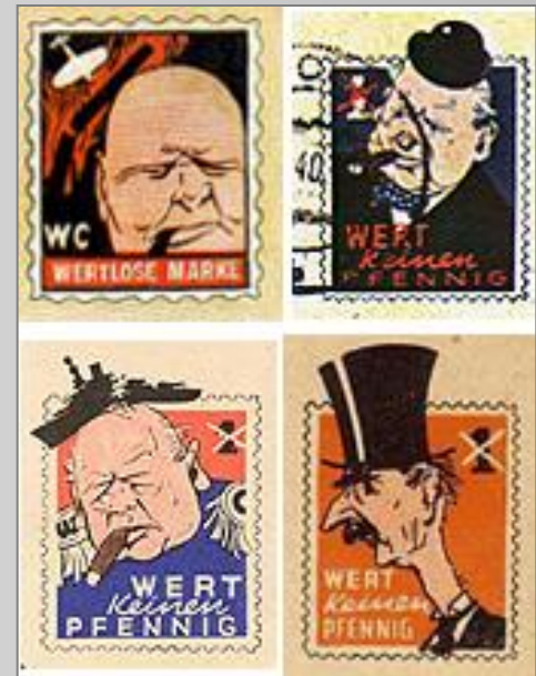
Немецкие почтовые марки-карикатуры на Черчилля. 1940—1944

Черчилль добивался помощи от США и получил ее с помощью закона о ленд-лизе и пересмотра законов о нейтралитете. Немало усилий он приложил для оказания помощи Франции. Черчилль поддерживал британское господство в Индии и Северной Африке и собрал вокруг себя людей, которые привели страну к победе.