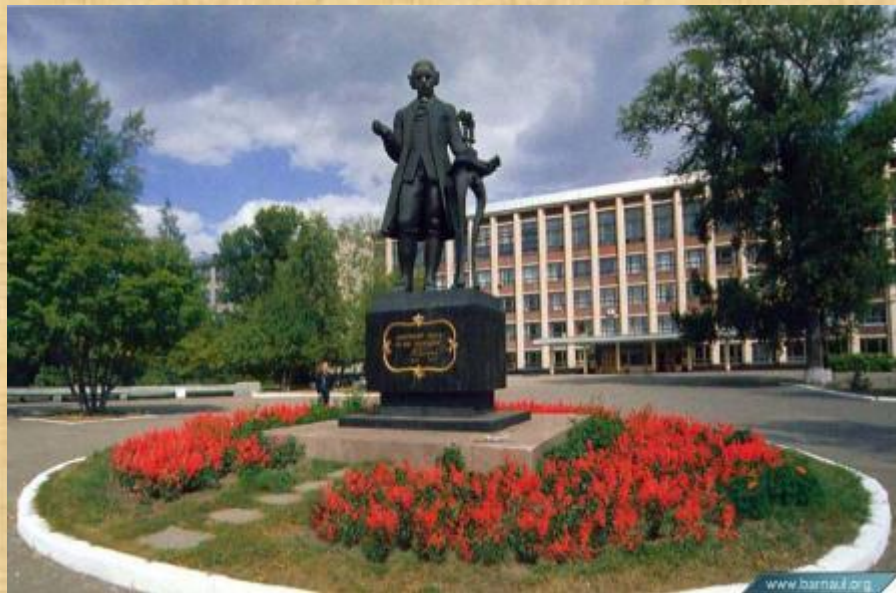
Памятник И. И. Ползунову перед зданием университета.

После университета перепробовала множество профессий: была переводчиком, секретарем диссертационного совета, менеджером среднего звена, графическим дизайнером, дизайнером интерьера и прорабом.