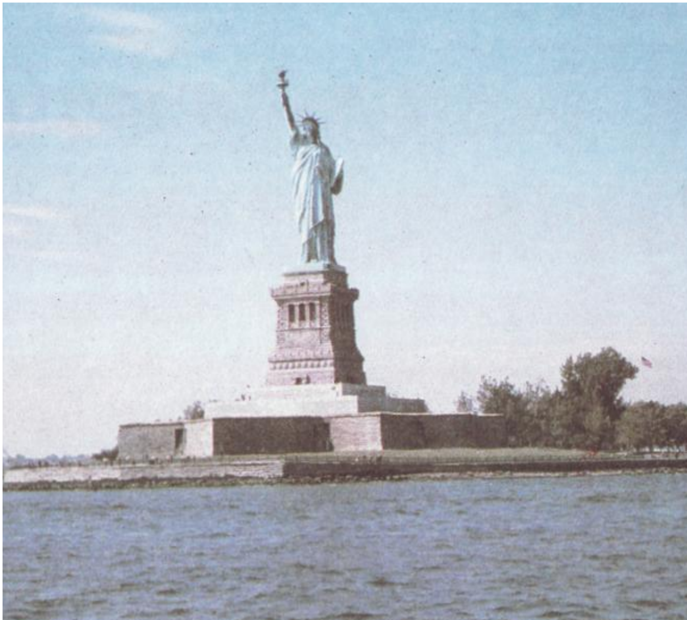
The Statue of Liberty