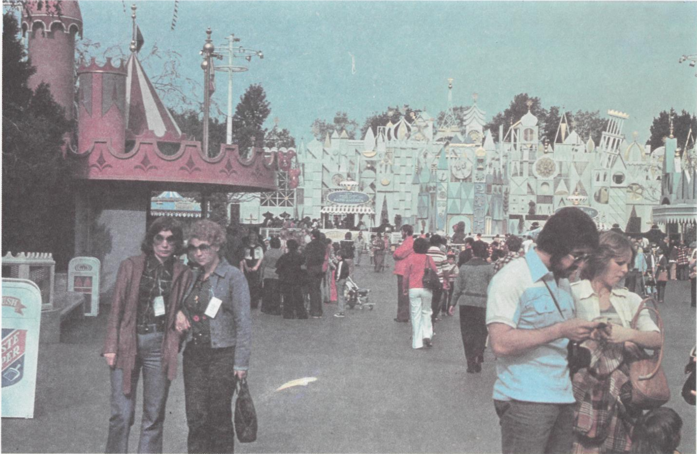
86. Los Angeles. Disneyland. Fairy Castle