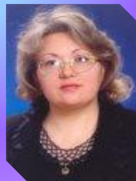
Зам.по воспит. работе