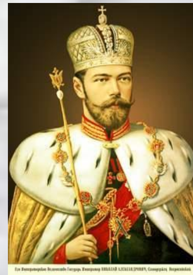
Его Императорское Величество Император АЛЕКСАНДРЪ ПЕРВЫЙ, Самодержецъ Всероссийскій