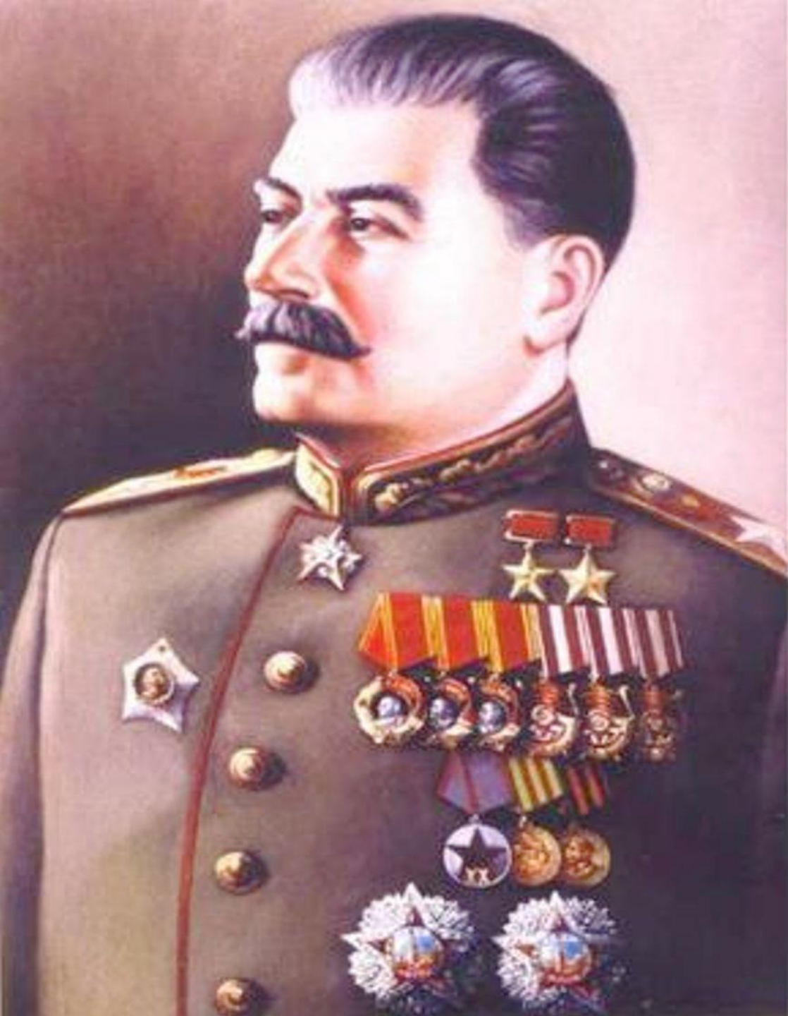
Йосиф Виссарионович Сталин