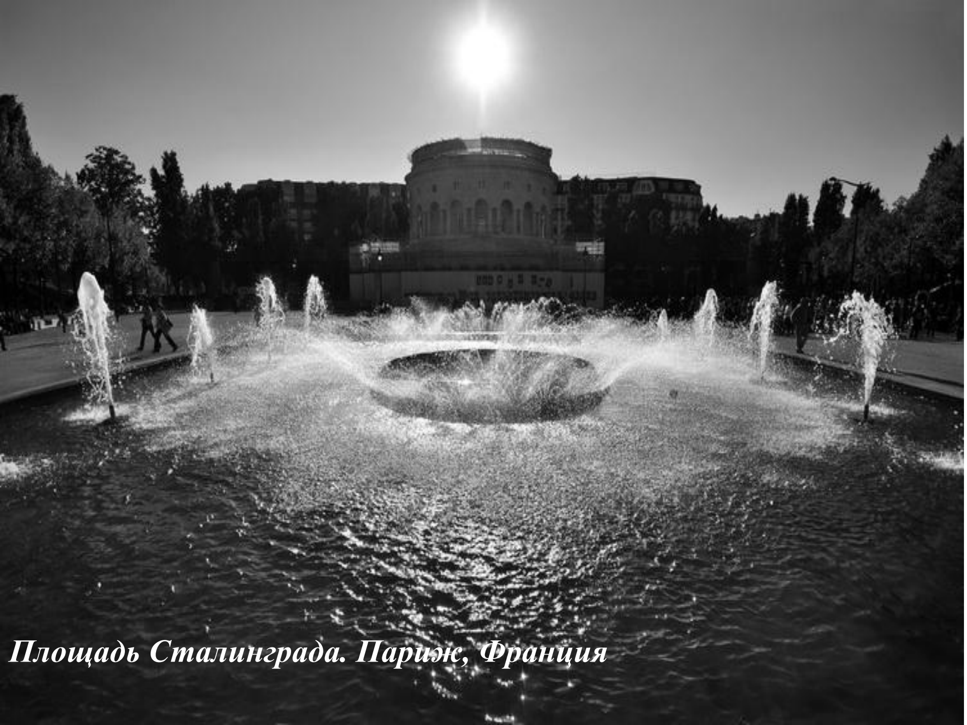
Площадь Сталинграда. Париж, Франция