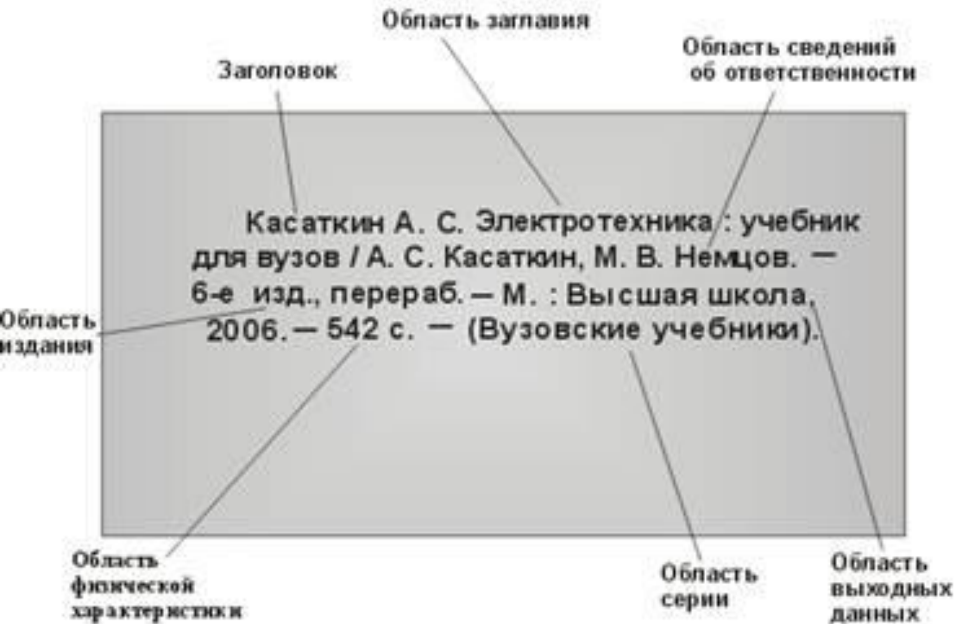
Рис. Схема библиографической записи