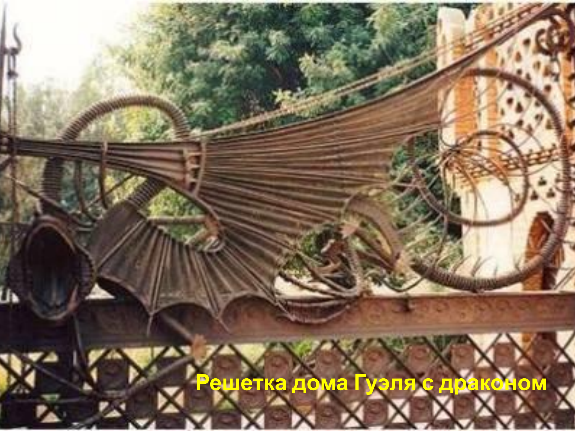
Решетка дома Гуэля с драконом